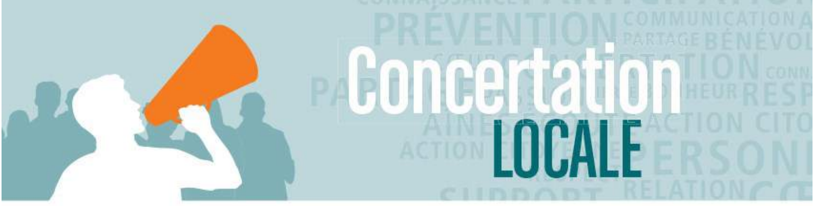
Table de concertation pour les personnes âgées de la MRC de Drummond