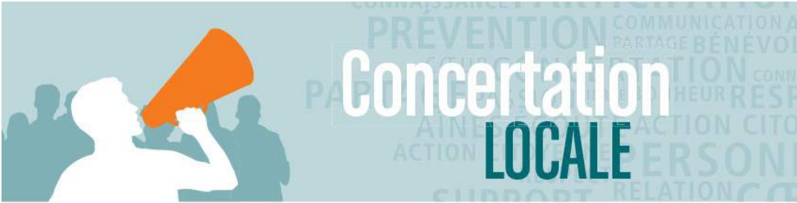
Table de concertation pour les personnes âgées de la MRC d'Arthabaska