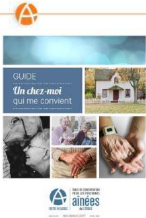
Table de concertation pour les personnes âgées de la MRC de L'Érable (TCPAÉ)